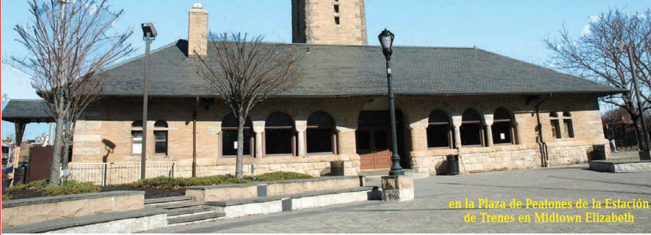
en la Plaza de Peatones de la Estación de Trenes en Midtown Elizabeth

El Lugar Perfecto para sus Fiestas Navideñas, Profesionales, Corporativas y Familiares. Salones para Toda Ocasión.